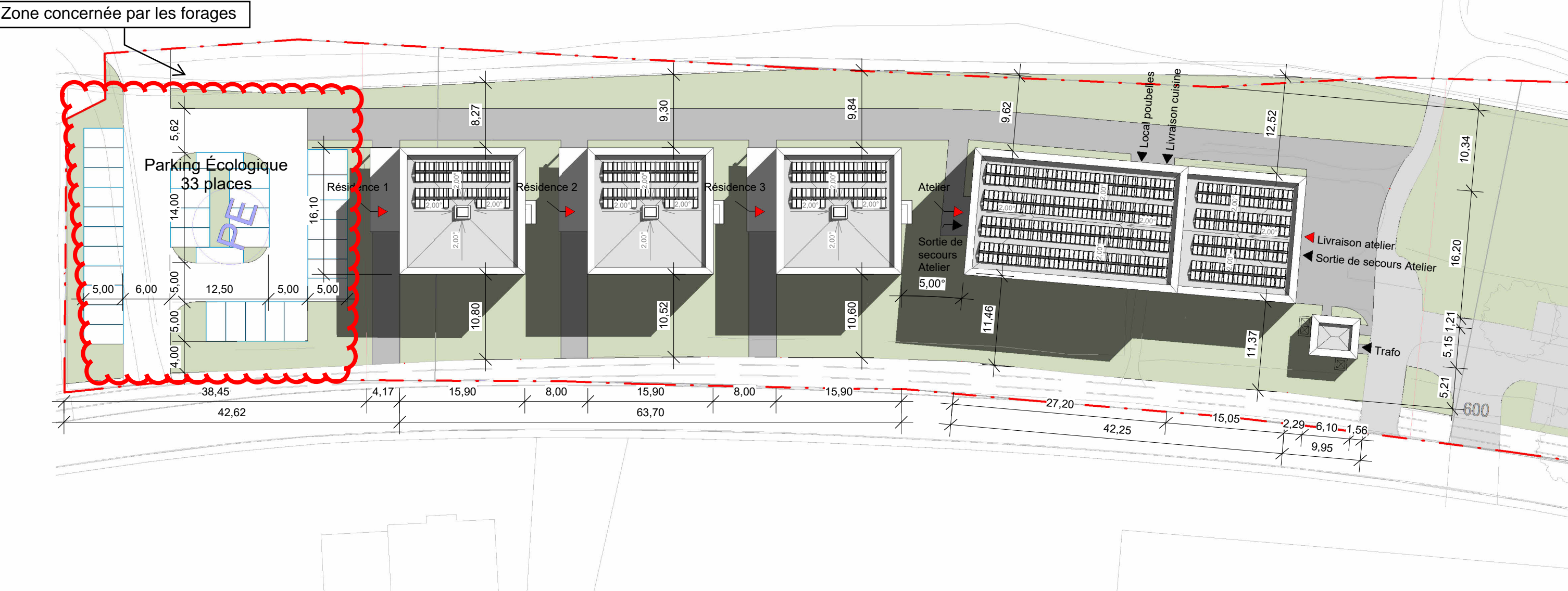
Plan masse 1/500