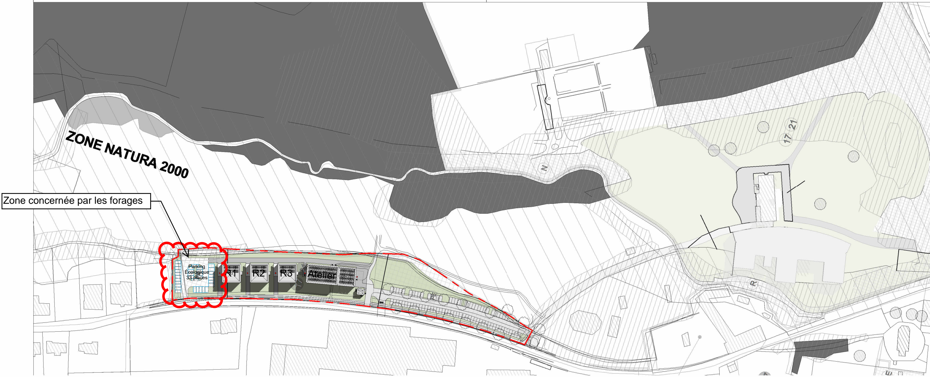
Plan de situation 1/2000